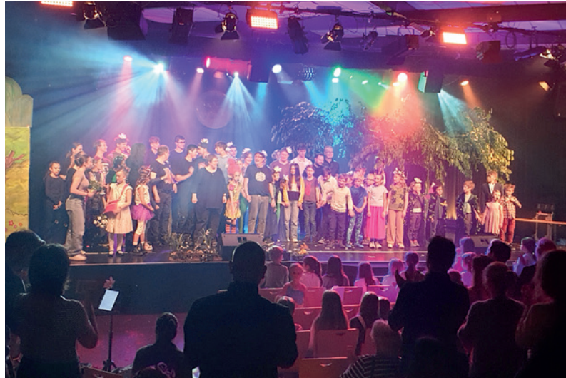
Beim Kultursommer Kaarst werden wieder zahlreiche Künstler auf verschiedenen Bühnen zu einem ganz besonderen Spaziergang durch die Kaarster Mitte eingeladen.